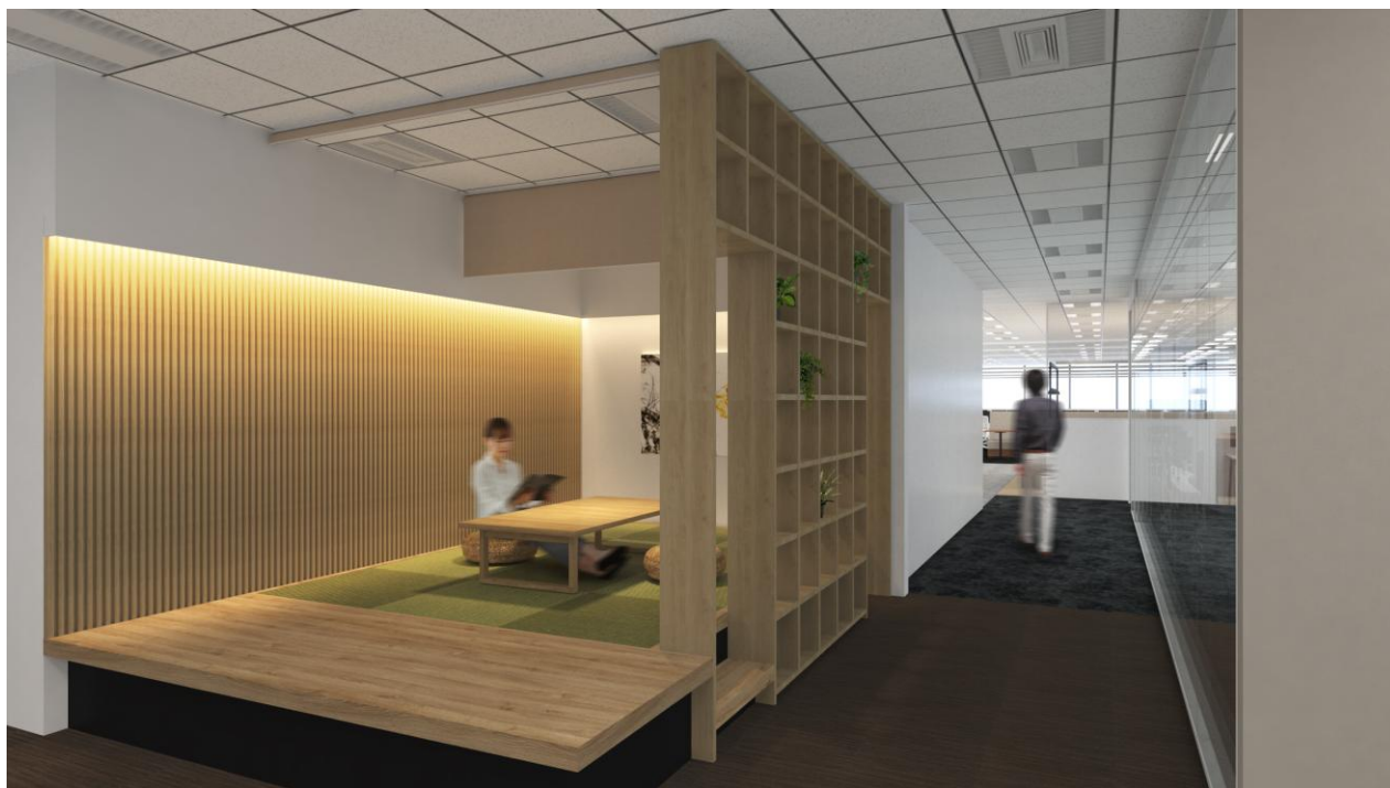
身心整備区（祷告和休息）